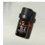
山霧 阿里山植感香氛精油 水漾