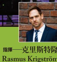
指揮——克里斯特隆 Rasmus Krigström

來自瑞典的 ZERO8 男聲合唱團，將帶來獨具魅力的理髮廳合唱。他們擁有出色的和聲技巧與音樂表演能力，在指揮克里斯特隆的帶領之下，以傳統男聲合唱演繹經典北歐曲目，他們以獨特的曲目及演唱風格，斬獲許多國際合唱大賽獎項，包括 2023 年斯洛維尼亞馬里博爾大賽總冠軍。本場音樂會特邀台北市私立復興中學合唱團、錦屏國小泰雅兒童合唱團與指揮李沛絨、張世傑同台演出，一同以樂音為台灣種下希望的種子。