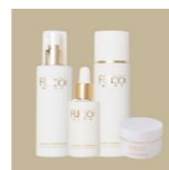
藻安美肌 肌底調和系列 經典保養組

合作 中國建設銀行 | FUCCI | 山霧 | 獅子寶寶 | Delizioso | 指定住宿 CAESAR METRO