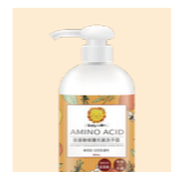
獅子寶寶 胺基酸修護抗菌洗手露