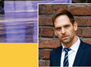
指揮——克里斯特隆 Rasmus Krigström

2023 年斯洛維尼亞馬里博爾國際合唱大賽總冠軍 2022 年瑞典歐洲理髮廳合唱大賽總冠軍